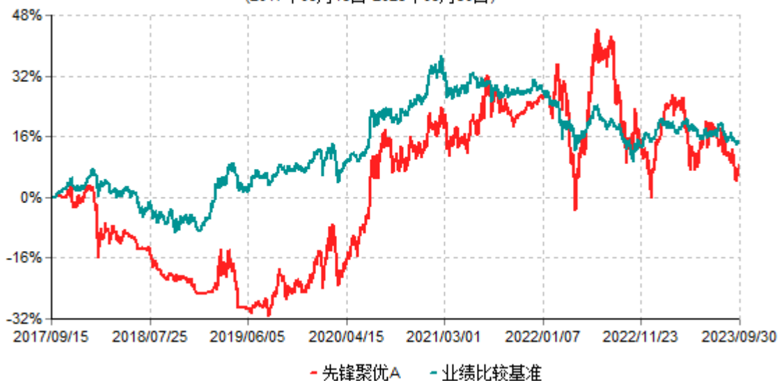
先锋聚优A累计净值增长率与业绩比较基准收益率历史走势对比图 (2017年09月15日-2023年09月30日)