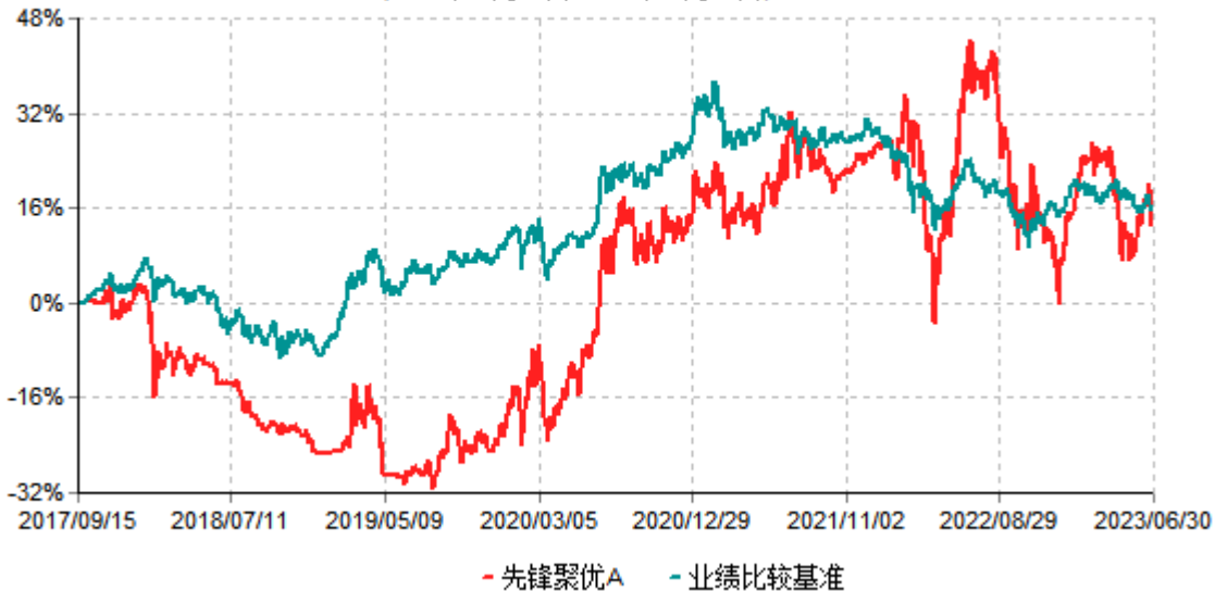
先锋聚优A累计净值增长率与业绩比较基准收益率历史走势对比图 (2017年09月15日-2023年06月30日)